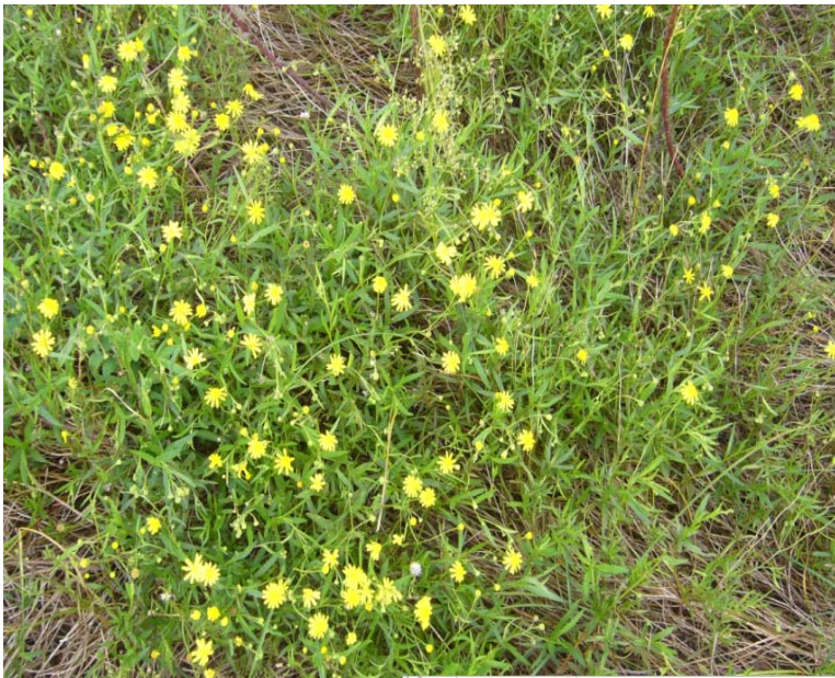
吉野川河口干潟(ナルトサワギク繁殖状況)

そこで吉野川のかかえる環境の問題点を知っていただくとともに、地域の皆さんの力を借りてナルトサワギクの抜き取りによる駆除作業を行い吉野川河口干潟の海浜植物などを守るため、吉野川現地(フィールド)講座を開催します。