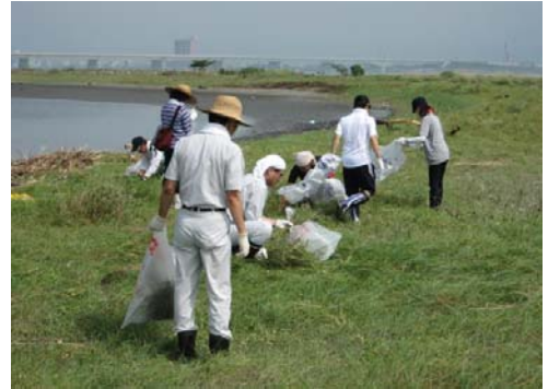
平成23年度の講座の状況①