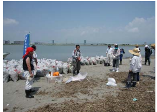
平成23年度の講座の状況②