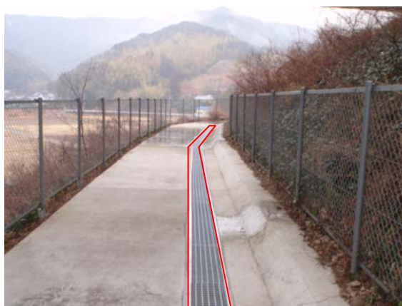
改良後: 側溝部に蓋掛け