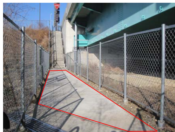
改良後: 通路に舗装整備