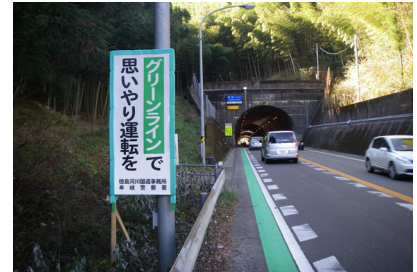
(阿南市福井付近のグリーンライン 及び案内看板の実施済み状況)