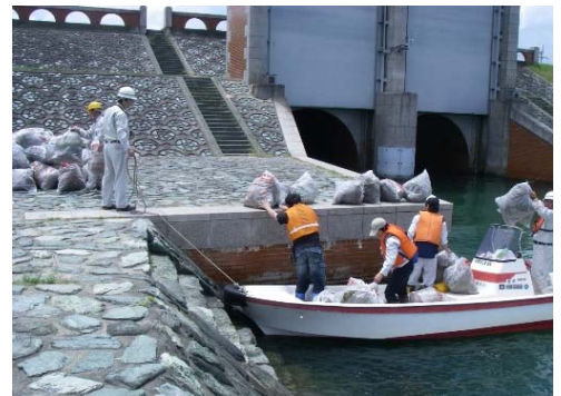
平成21年度の講座の状況②