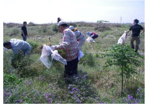
平成21年度の講座の状況①