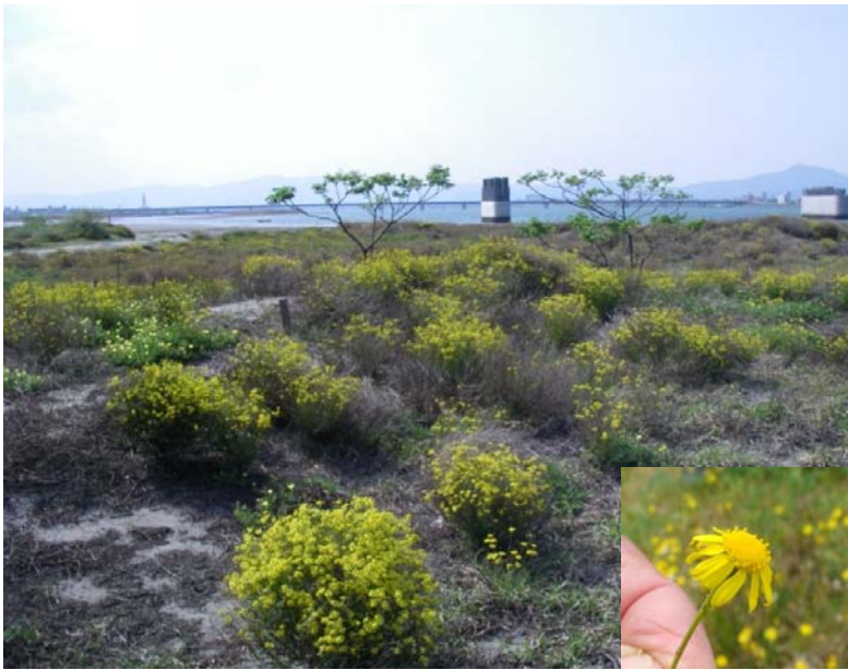
吉野川河口干潟(ナルトサワギク繁殖状況)

そこで吉野川のかかえる環境の問題点を知っていただくとともに、地域の皆さんの力を借りてナルトサワギクの抜き取りによる駆除作業を行い吉野川河口干潟の海浜植物などを守るため、吉野川現地(フィールド)講座を開催します。