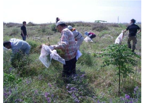
平成21年度の講座の状況①