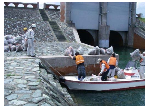
平成21年度の講座の状況②