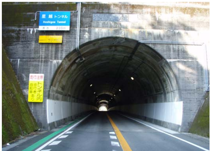
山間部のカーブ区間でのグリーンライン実施状況