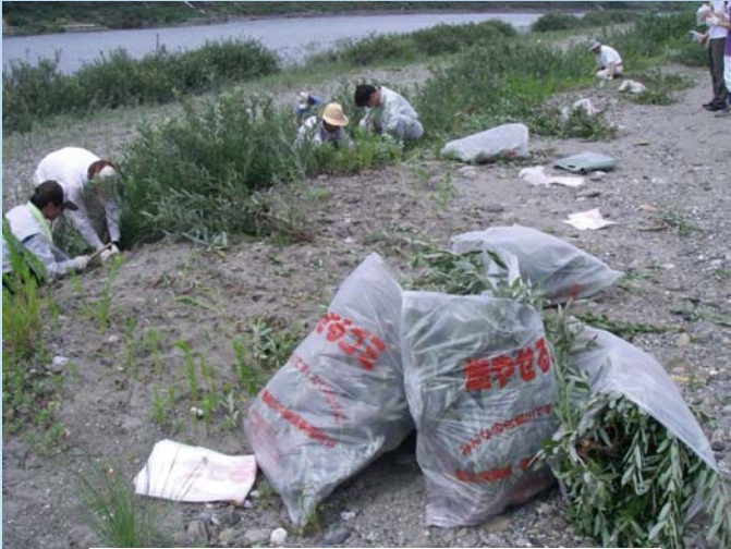
H21.7.11第3回フィールド講座で ヤナギを伐採しましたが・・・