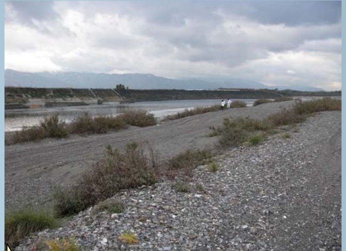
再び成長し、枝を伸ばしています。 (H21.12.11)