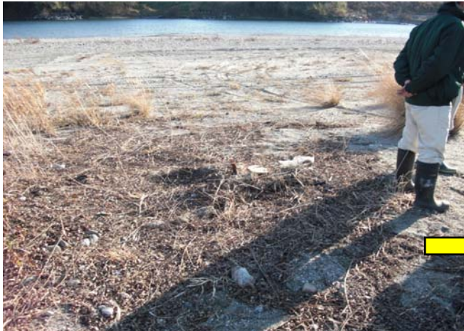
H21.1.16撮影 西条大橋左岸上流側砂州(ヤナギ伐採状況)

最近吉野川では、ヤナギなどの樹木が河原でたくさん生えることにより樹木の下流側に砂山ができ、河原の姿が大きく変化したり、外来植物である、シナダレスズメガヤが広がりやすくなるなど、もともと河原に生きる生き物への悪影響が心配されています。徳島河川国道事務所では平成20年度にその原因であるヤナギを伐採しました。しかし、生命力の強いヤナギは伐採しても再び萌芽を繰り返します。そこで吉野川現地(フィールド)講座を開催し、地域の皆様のご協力を得て萌芽したヤナギを再度伐採したいと思います。ご協力お願いします。