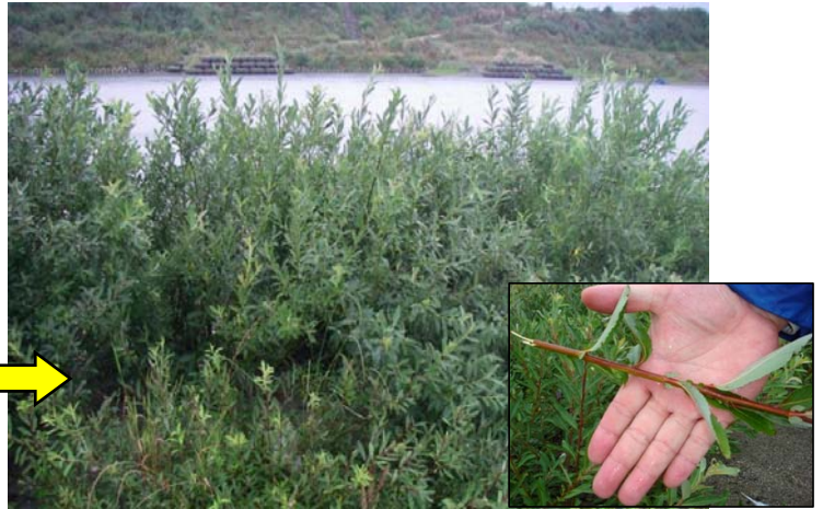
H21.6.10撮影 西条大橋左岸上流側砂州(ヤナギ繁殖状況)