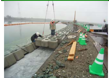
④根固めブロック施工状況