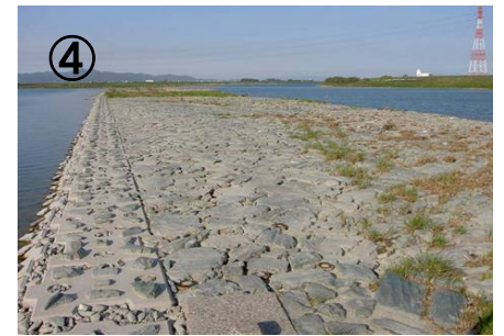
H18施工箇所(完成写真)