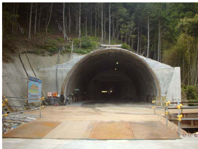
北白浜トンネル(仮称)坑口