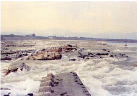
写真 - 7 第十堰 昭和49年洪水による被災