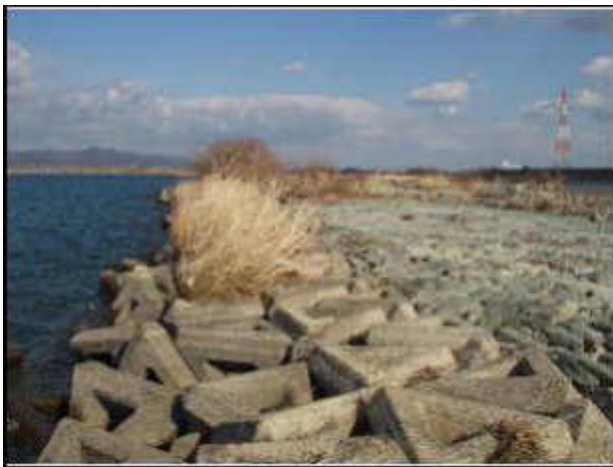
写真 - 3 青石張上流部 (上堰)