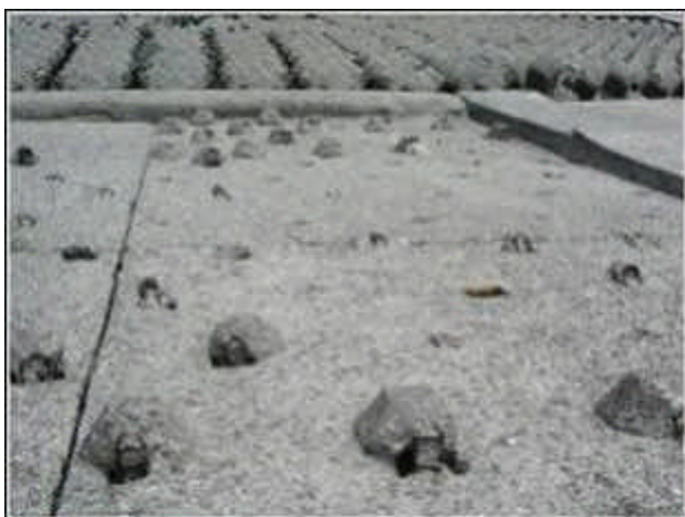
写真 - 5 粗石コンクリー破損状況