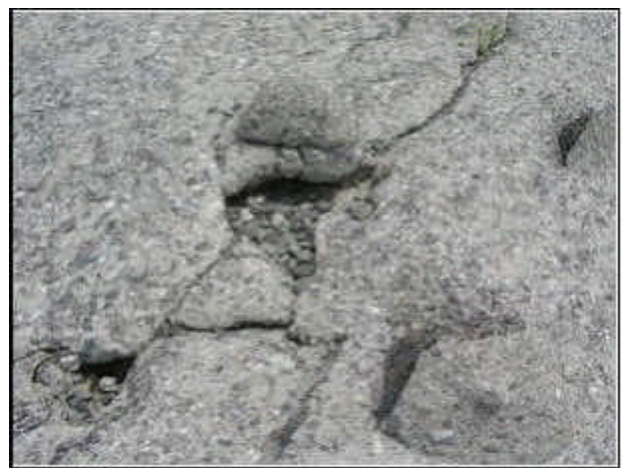
写真 - 6 粗石コンクリー破損状況