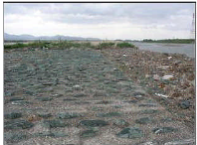
写真 - 4 第十堰 練石張の状況 (上堰)