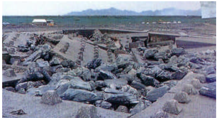
写真 - 8 第十堰被災状況