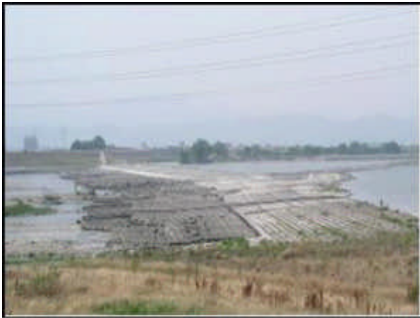
写真 - 1 第十堰の状況 (左岸側堤防より)