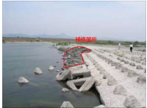
写真 - 2 下堰平張コンクリー施工箇所付近