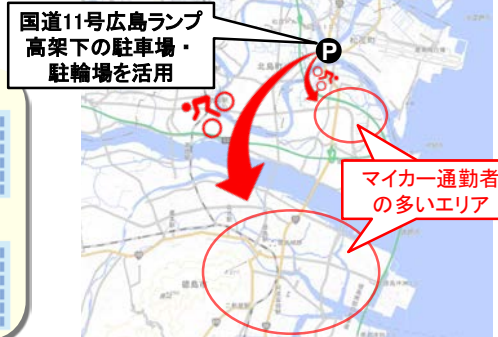
パーク・アンド・サイクルライド駐車場・駐輪場位置図