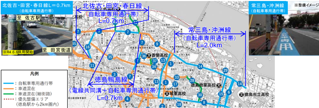
徳島市自転車ネットワーク優先整備路線図