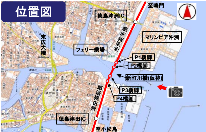
※この地図は国土地理院の地理院地図に加筆したものである。

新町川橋(仮称)は橋長500mの鋼3径間連続鋼床版箱桁橋で、連続箱桁橋として支間長250mは国内最大級の規模を誇る。 四国横断自動車道(徳島津田IC～徳島沖洲IC)の一部であり、令和2年度開通を目指している。