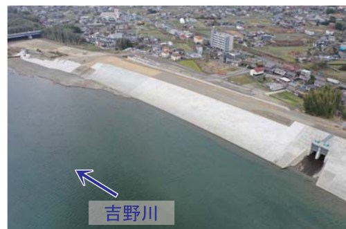
▲加茂第二箇所【東みよし町加茂地先】

洪水のたびに浸水被害が発生している吉野川の無堤地区において、早期に洪水防御を図るべく、築堤事業を計画的に実施します。