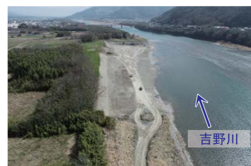
▲沼田箇所【美馬市美馬町沼田島地先】

近年の災害を踏まえ実施した重要インフラの緊急点検に基づいて早期に地域の安全性の向上を図るべく、河道掘削及び樹木伐採を計画的に実施します。