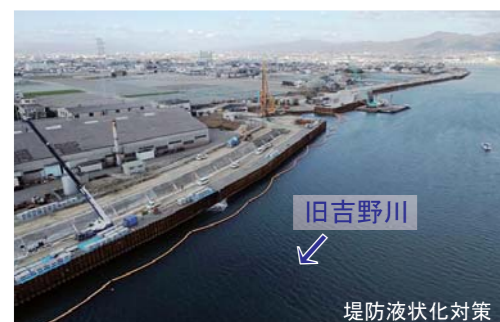
▲豊久箇所【松茂町豊久地先】

今後発生すると予測されている南海トラフ地震等に備えるため、堤防や樋門の耐震化を行います。