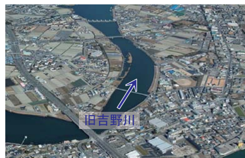
▲中喜来・広島箇所【松茂町地先】

2021年度は、加茂第二箇所（東みよし町）、半田箇所（つるぎ町）、沼田箇所（美馬市）の築堤事業を行います。