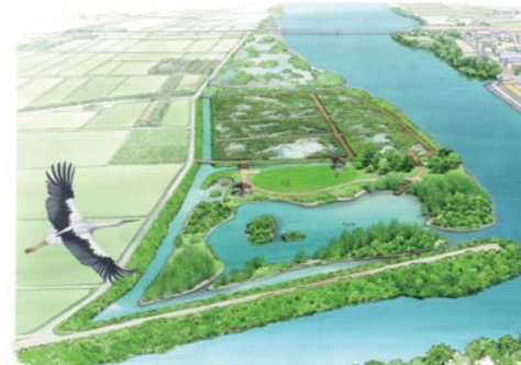
▲大麻箇所イメージパース（津慈地区）【大麻町・藍住町地先】

旧吉野川大麻箇所【津慈地区】（鳴門市・藍住町）において生物の多様な生息・生育環境を確保しつつ、自然環境の保全・復元を行う自然再生事業を実施します。