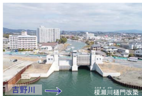
▲応神箇所【川内町鈴江南地先】

吉野川においては、地震発生による樋門の損傷を防ぐ事業として、榎瀬川樋門の改築を行います。