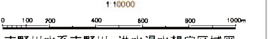
吉野川水系吉野川 洪水浸水想定区域図(家屋倒壊等氾濫想定区域(河岸侵食))【10/11】