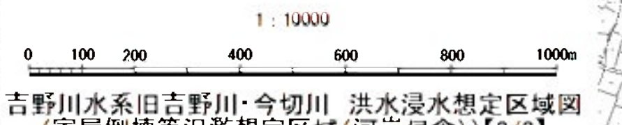
吉野川水系旧吉野川・今切川 洪水浸水想定区域図(家屋倒壊等氾濫想定区域(河岸侵食))【3/3】