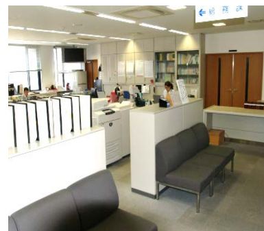
書庫等による執務室の区分