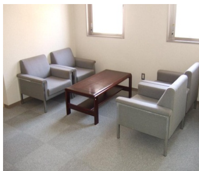
応接スペースの設置