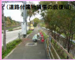
(道路付属物損傷の仮復旧)