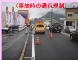
(事故時の通行規制)