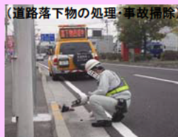
(道路落下物の処理・事故掃除)