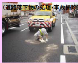
(道路落下物の処理・事故掃除)