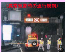
(異常気象時の通行規制)