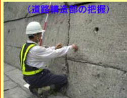
(道路構造物の把握)