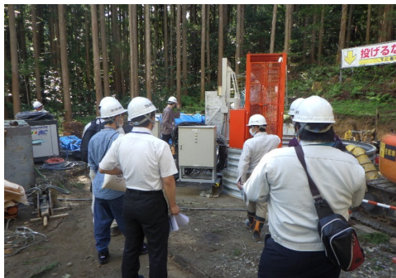
集水井のエレベータ試乗