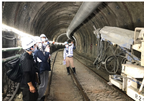
排水トンネル内部での調査