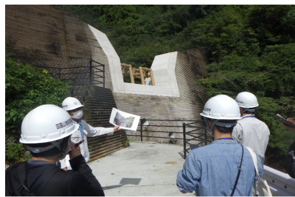
砂防堰堤改良工事の見学