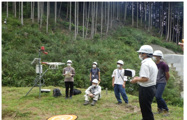
ドローン操作体験