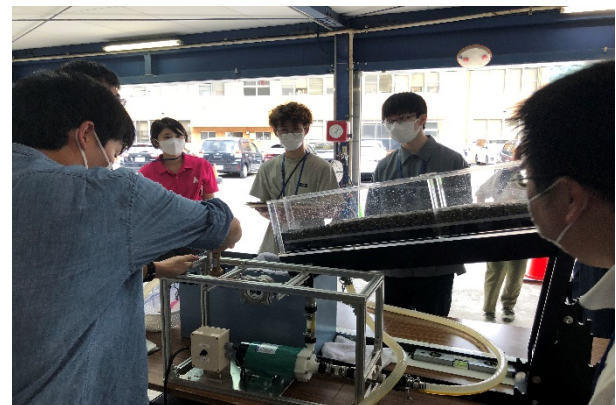
土石流実践装置体験