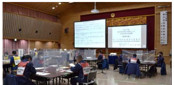
高知県梶原町(令和2年度) 合同対応訓練の様子