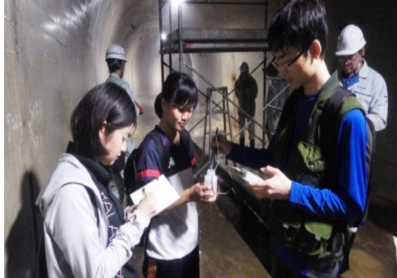
排水トンネル内部での調査