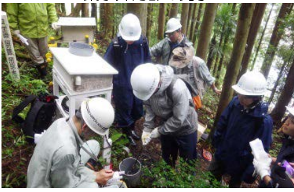
地すべり観測施設の見学