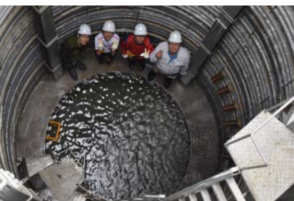
集水井内部の見学