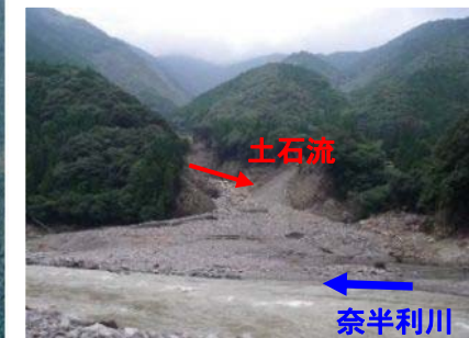
ダム湖への土砂流入状況