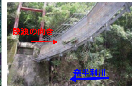
段波による上流側平鍋吊橋崩壊 (大谷川より約0.8km上流)