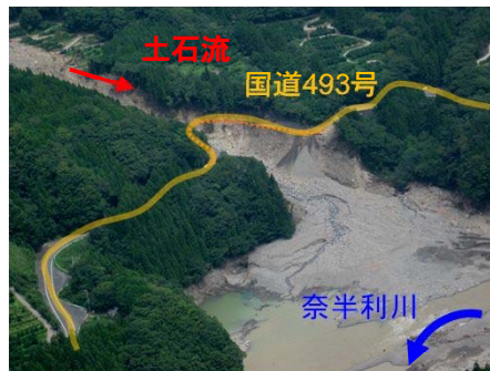
国道493号の橋梁流失