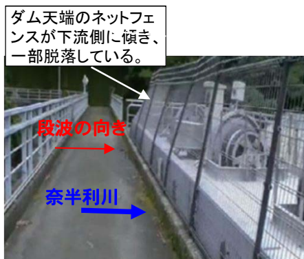
ダム天端のネットフェンスが下流側に傾き、一部脱落している。 段波による越流で洪水吐ゲート制御機器の機能不全