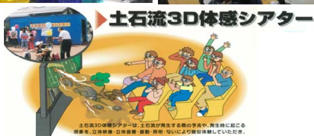
土石流3D体感シアターは、土石流が発生する際の予兆や、発生時に起こる現象を、立体映像・立体音響・運動・照明・匂いにより疑似体験していただき、土砂災害への備えに役立てていただけます。