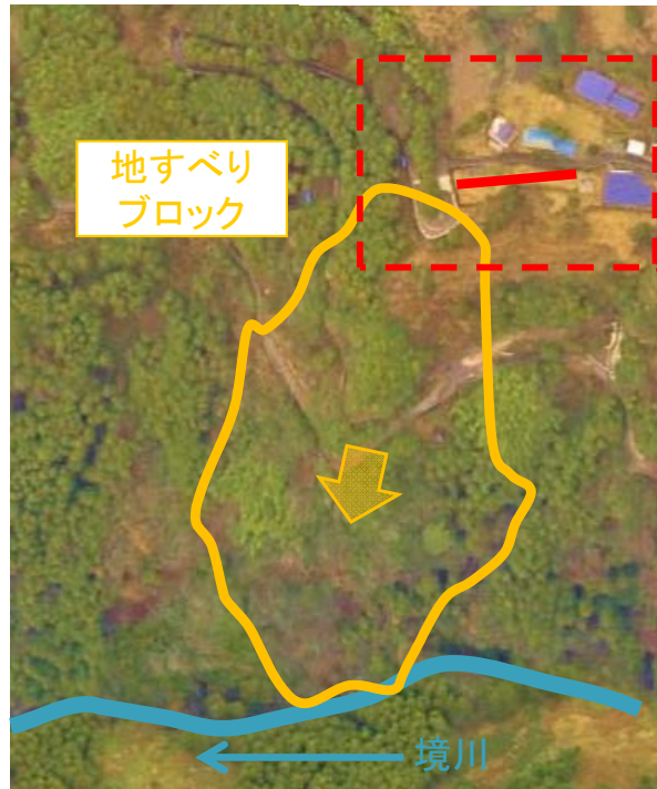
地下水排除工 (ディープウェル工)