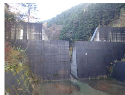
透過型砂防堰堤イメージ