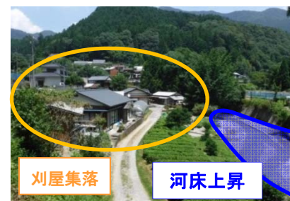
刈屋集落 河床上昇