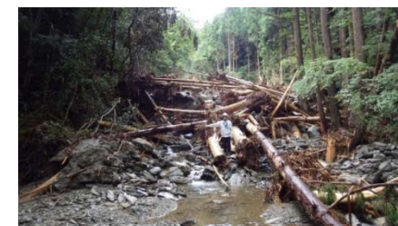
上流の荒廃状況(行川)