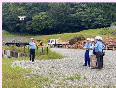
ドローン操作体験