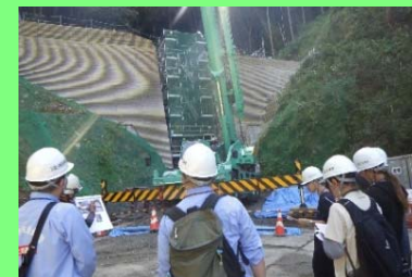
砂防堰堤工事の見学