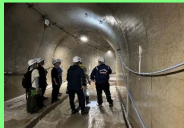
排水トンネル内部の見学

【9月13日（水）】場所：三好市の現場、大川村の「自然王国 白滝の里」 吉野川中流域の工事現場見学、地すべり調査体験、大川村長講話