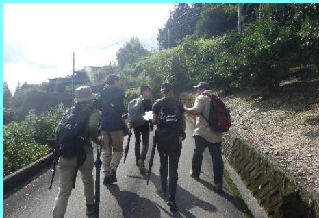
霧石溪谷トレッキング

【9月13日（水）】場所：三好市の現場、大川村の「自然王国 白滝の里」 吉野川中流域の工事現場見学、地すべり調査体験、大川村長講話