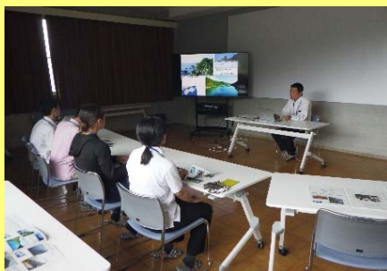
開校式・事務所長の講話

【9月11日（月）PM】場所：ウマバ・スクールコテージ 開校式、事務所長講話、三好みらいのまちづくりの取組み、 三好市長と研修生・若手職員との意見交換