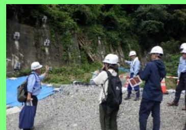
地すべり調査の体験