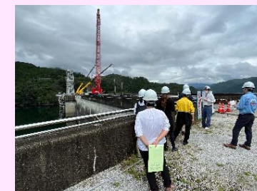
早明浦ダムの見学