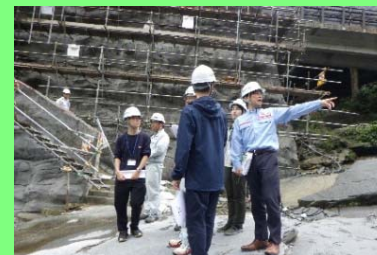
景観に配慮した護岸工事の見学