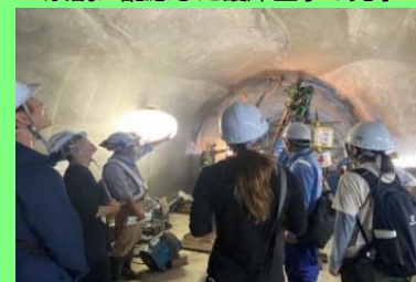
排水トンネル工事の見学