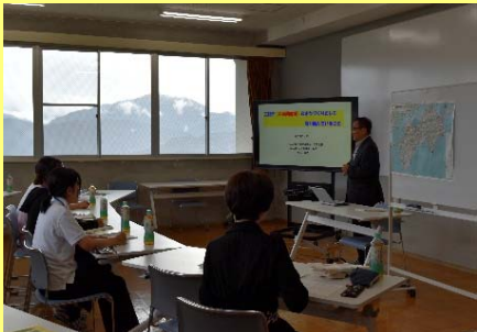
三好市まちづくりへの取組みの説明