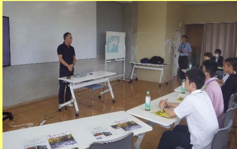
脱炭素化社会への取組みの説明

【9月12日（火）】場所：三好中山間地域、大豊町の「霧石溪谷」 三好ジオツアー、霧石溪谷トレッキングコース