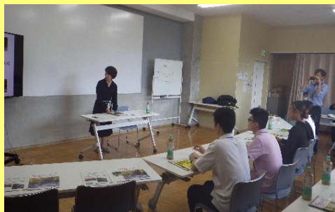
高井美穂三好市長の講話