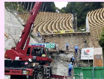
砂防堰堤工事の見学