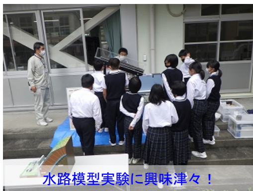
水路模型実験に興味津々！