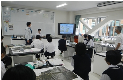
職員による土砂災害の講義