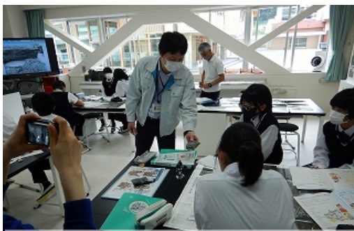
大豊町の地形・地質の特徴