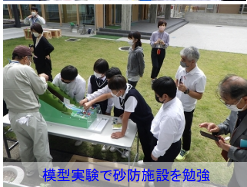
模型実験で砂防施設を勉強