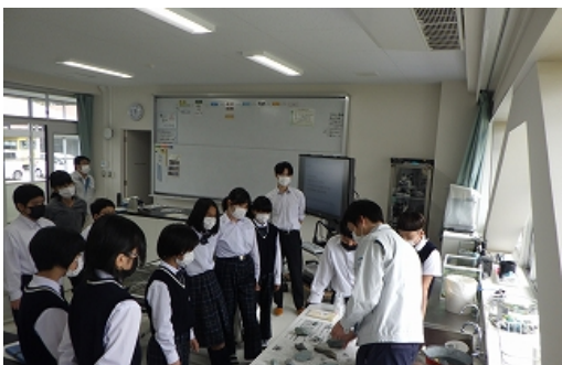
生徒のみなさん真剣な眼差しです