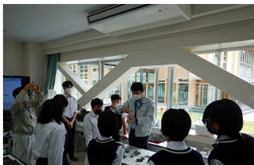
大豊町内で採取した岩石を紹介