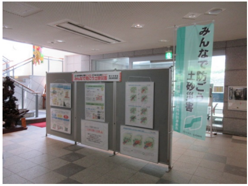
大豊町総合ふれあいセンター