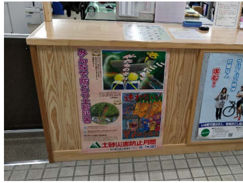
いの町本川総合支所