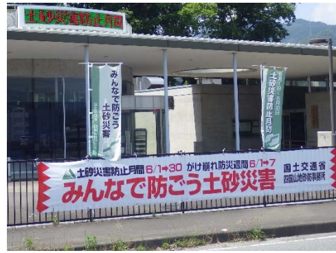
重信川砂防出張所