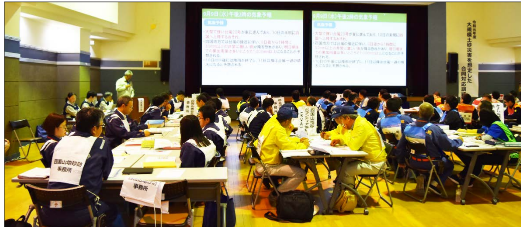
災害時の初動対応から応急対策まで、各段階での各機関の動きを発表し、相互の連携を確認しました。

令和元年11月13日(水)、徳島県東みよし町で台風による豪雨や南海トラフ地震時に発生が懸念される大規模土砂災害を想定した合同対応訓練を実施しました。大規模土砂災害の発生時には、多くの関係機関が連携して対応する必要があることから、本訓練では、 国土交通省、気象庁、徳島県、東みよし町、消防、社会福祉協議会 など、実際の災害時に関係する機関、 総勢61名 が参加し、より実態に近い形で災害時の連携を確認しました。