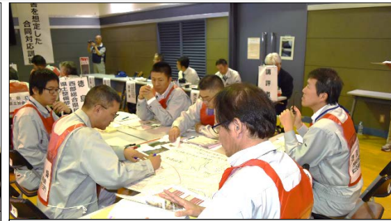
応急対策工法の検討

参加機関の皆様より、 ● この訓練で関係する機関の役割を確認できたことは有意義、今後の対応に活かしたい ● 日頃から情報共有を密にし、本当に重要な局面が来た時に即座に対応できるようにしたい 等のご意見・ご感想をいただきました。