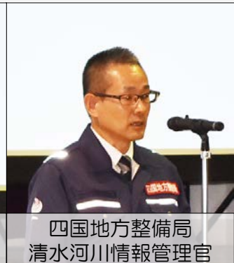
四国地方整備局 清水河川情報管理官