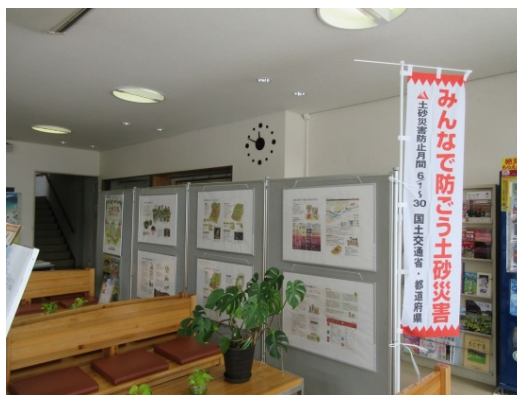
本山町プラチナセンター