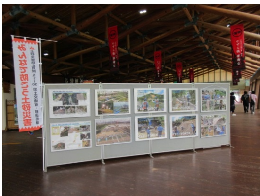
かずら橋夢舞台イベント会場

かずら橋夢舞台内イベント会場(6/3～6/11)、本山町プラチナセンター(6/11～6/18)、三好市池田総合体育館(6/18～6/28)の3カ所にて巡回展示を行いました。