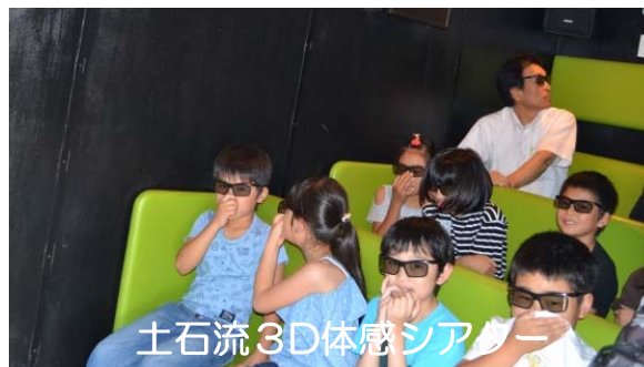
土石流3D体感シアター