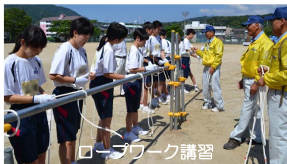
ロープワーク講習