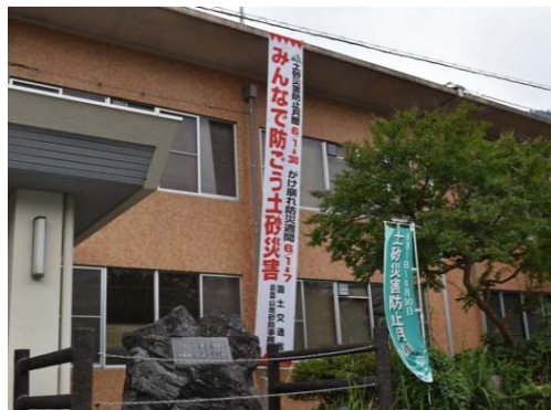
四国山地砂防事務所

四国山地砂防事務所・重信川砂防出張所・吉野川砂防出張所・祖谷監督官詰所・大豊監督官詰所・北川村詰所・関係8ヶ市町村役場 そのほかJR阿波池田駅、管内の道の駅などで掲示し、土砂災害防止意識の啓発活動を行いました。