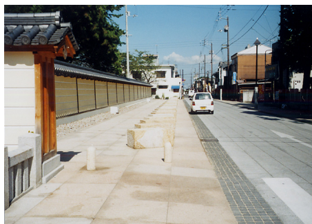
整備が進む善通寺地区の新四国のみちエリア。 (10月4日には「美しいまちなみ賞」の優秀賞を受賞予定)