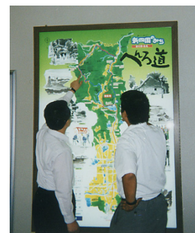
「道の駅ながお」の情報コーナーに展示してある内照式の新四国のみちルート図の展示状況

5町合併により長尾町からさぬき市となったため、少しバタバタしましたが、新四国のみちのエリアは「まちづくり総合支援事業」を活用し、今年度からハード整備に着手しています。また、10月20日(日)には新市誕生記念としてウォーキングイベントを予定しています。今後の予定としては、広報用ツールであるパンフレットを一部修正し、増刷したいと考えています。