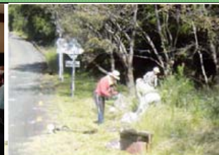
アドプト活動状況