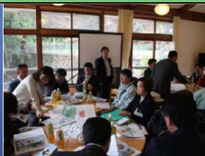
ワークショップ状況