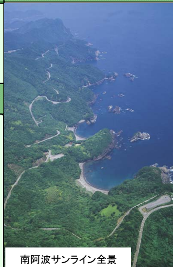
南阿波サンライン全景