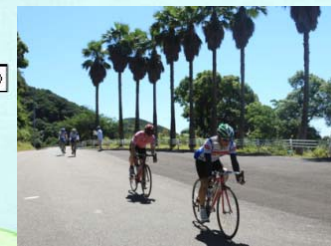
四国の右下ロードライド