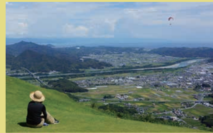
石土ノ森から仁淀川を望む

高知県のほぼ中央部に位置する土佐市。清流「仁淀川」の豊かな水域と、暖流、黒潮の恩恵を受ける土佐市は、豊かな気候に恵まれ様々な農作物の栽培が盛んです。一方、カツオ漁業の基地として栄えた海沿いでは、釣り人に人気のフィッシングポイントも多く、大人気のホエールウォッチングをはじめ、サーフィン、海水浴などのマリナーが楽しめる場所として多くの人々に愛されています。