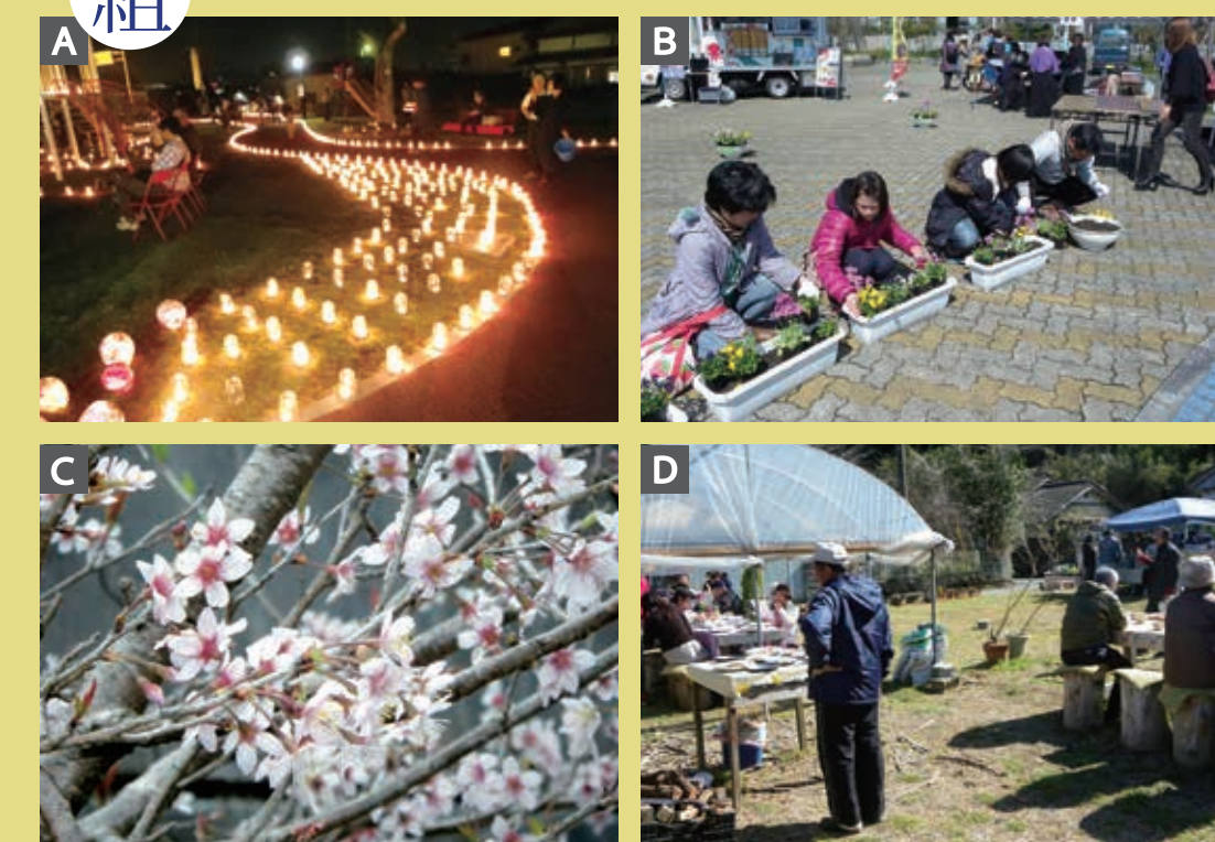
A 土佐市トンボ公園キャンドルナイト B 市街地の景観美観・植栽活動 C 土佐市固有の桜「ほのかざくら」 保護・保全活動 D 無農薬ブルーベリーや野草栽培の取組・野外カフェイベント開催等「里山」

「土佐市ドラゴン風景街道推進協議会」では、文化史跡や自然を楽しむサイクリング・ハイキングコースの提案、土佐市民公園(通称トンボ公園)でのキャンドルナイトなどのイベントの開催、土佐市由来の匂い桜「ほのかざくら」の増植をはじめとしたまち中の緑化計画及び地域資源を活かした土佐市のPRなどの活動を行っています。