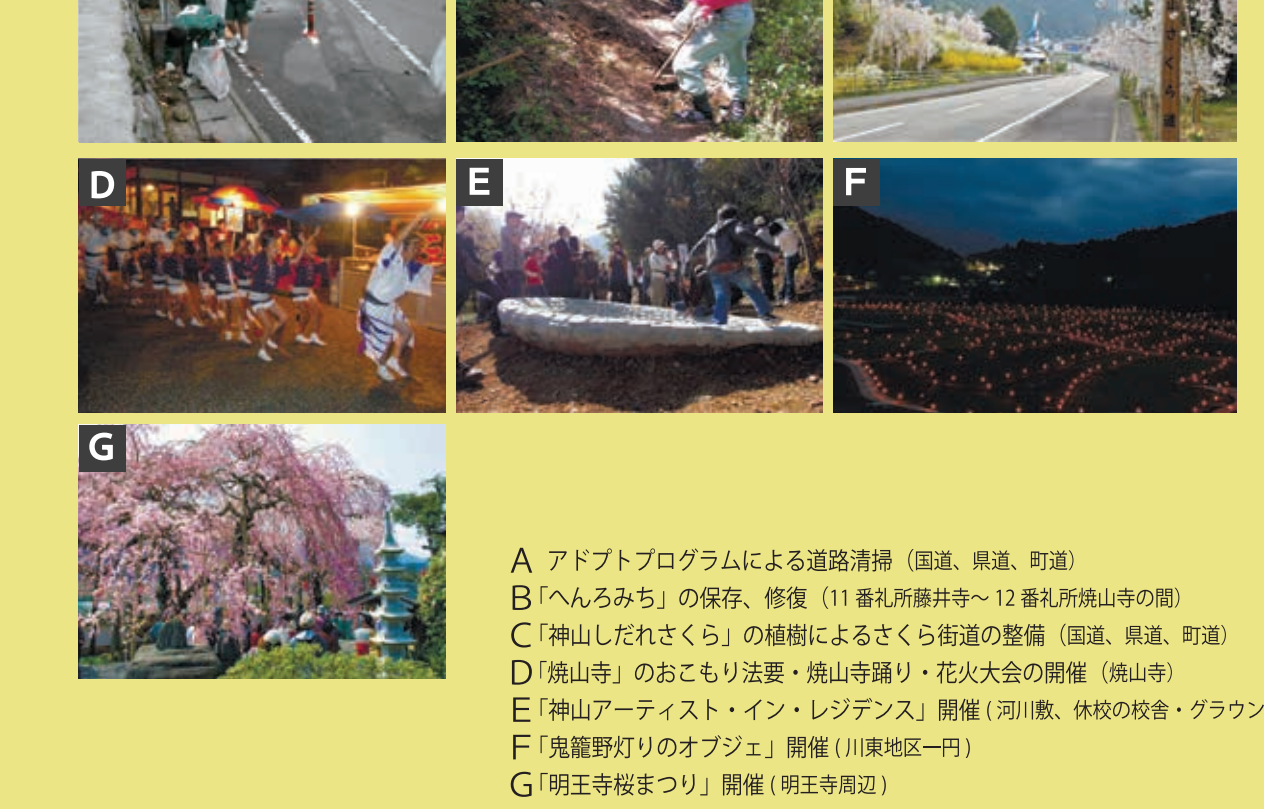
A アドプトプログラムによる道路清掃（国道、県道、町道） B「へんろみち」の保存、修復（11番礼所藤井寺～12番礼所神山寺の間） C「神山しだれさくら」の植樹によるさくら街道の整備（国道、県道、町道） D「神山寺」のおこもり法要・焼山寺踊り・花火大会の開催（焼山寺） E「神山アーティスト・イン・レジデンス」開催（河川、林の校舎・グラウンド） F「鬼籠野灯りのオブジェ」開催（川東地区一円） G「明王寺桜まつり」開催（明王寺周辺）

四季折々に神山町の豊かな歴史や自然を活かしたイベントが開催されます。特にサクラやウメなどが咲き誇る春には、数多くのイベントが開催され、県内外から多くの人で賑わいます。