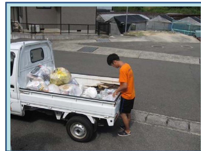
<キャンプ場ゴミ分別収集状況>