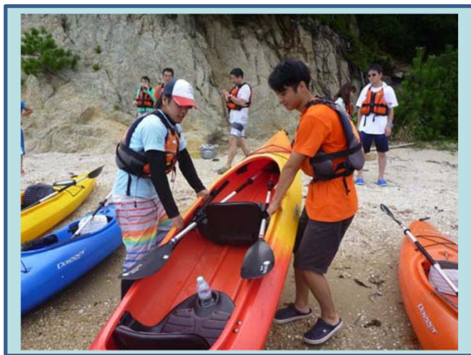
<カヤック体験補助作業状況>