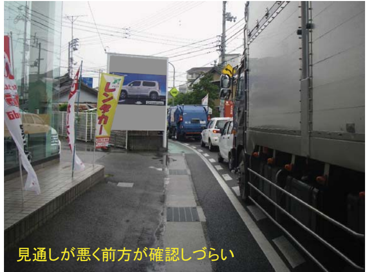
見通しが悪く前方が確認しづらい