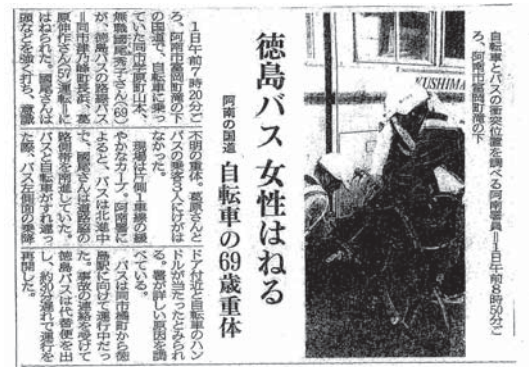
H21. 10. 2 徳島新聞

死傷事故率 : 187.8 件 / 億台 k m 自動車交通量 : 19,700 台 / 日 自転車交通量 : 1,091 台 / 12h 歩行者交通量 : 70 人 / 12h ※H17 年度センサス