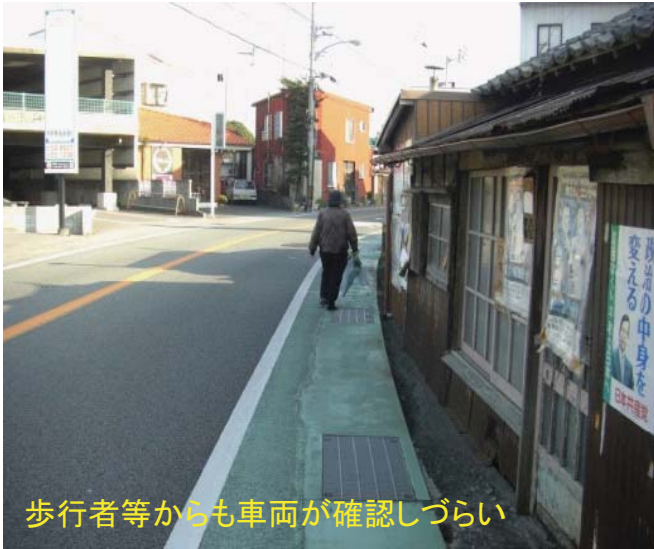
歩行者等からも車両が確認しづらい