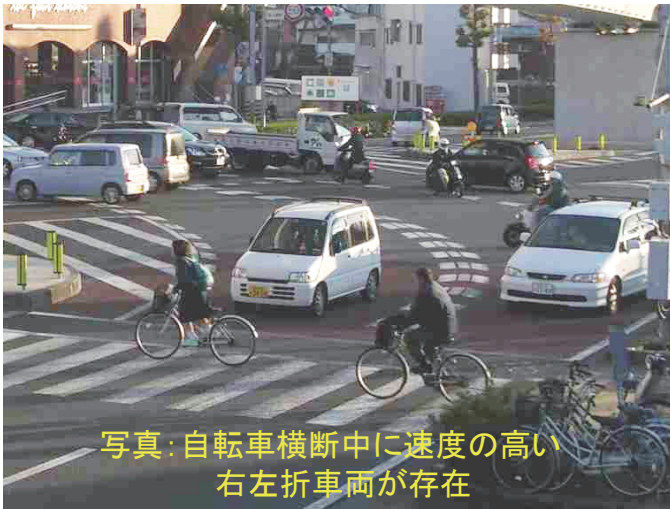
写真：自転車横断中に速度の高い右左折車両が存在