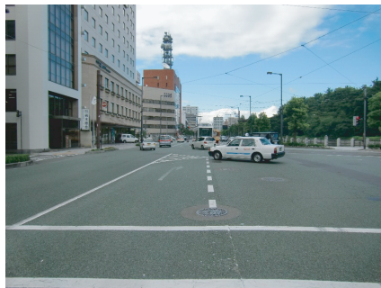
①自動車・路面電車が輻輳している