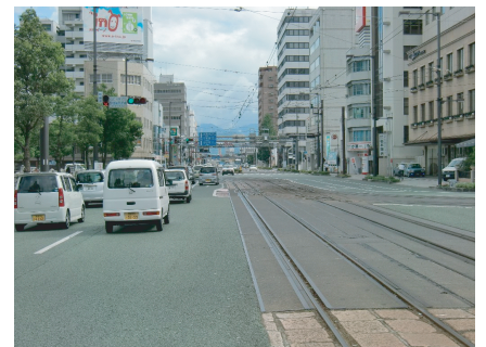
②自動車・路面電車が輻輳している

死傷事故率： 473件/億台キロ 死傷事故件数： 55件/4年 自動車交通量： 40,500台/日 自転車交通量： 3,400人/日 歩行者交通量： 300人/日 ※H17-20年データ