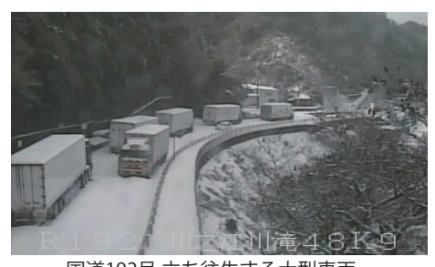
国道192号 立ち往生する大型車両