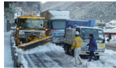
支援部隊による除雪