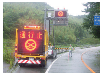
国道55号(徳島県阿南市福井町)