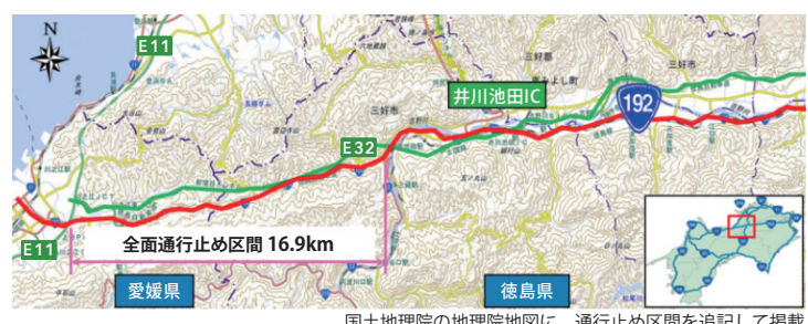
国土地理院の地理院地図に、通行止め区間を追記して掲載