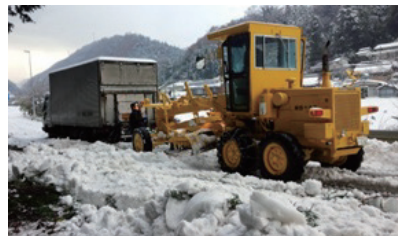
除雪車により車両を牽引