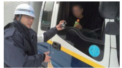
ドライバーへおにぎりとお茶を提供