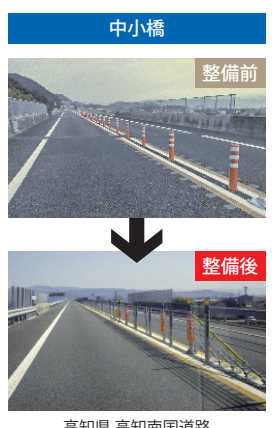
高知県 高知南国道路