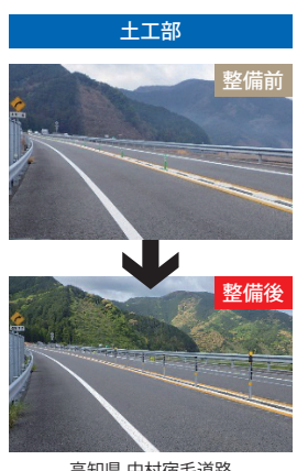
高知県 中村宿毛道路

■ 高速自動車道等の暫定2車線区間等における、対向車線への飛び出し事故(正面衝突事故)の緊急対策としてワイヤーロープの設置を推進