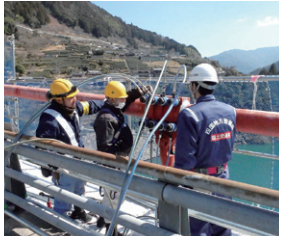
修繕代行の実施状況（大渡ダム大橋）