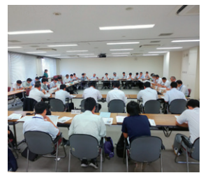
道路メンテナンス会議の開催（香川県）