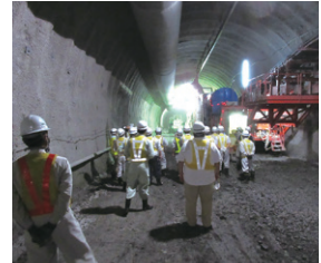
整備局主催の研修開催（愛媛県）