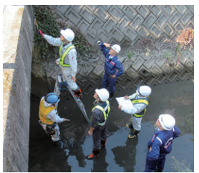
研修セミナーの開催（徳島県）