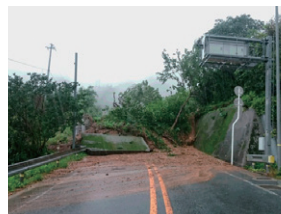
H30.7.7 法面崩壊による災害 愛媛県宇和島市吉田町白浦

また、異常気象時における国民生活への影響を最小限にとどめるため、過去の災害履歴や対策実績を踏まえ、事前通行規制の緩和・解消を推進