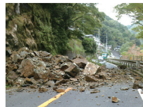
H29.10.24 土砂崩壊による災害 徳島県三好市山城町