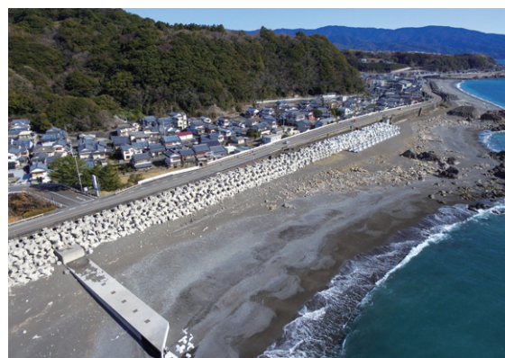
国道55号 高知県安芸郡安田町 現在の状況