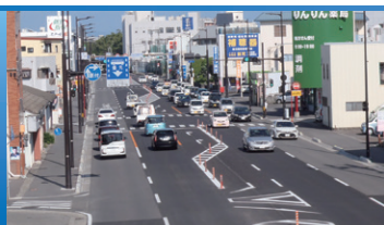
国道192号 庄町地区電線共同溝(徳島県)

道路の地下空間を利用して、 道路から電柱や電線をなくすことで、 「防災」、「景観・観光」、「安全・快適」のために 無電柱化を実施