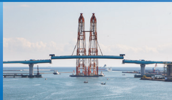
四国横断自動車道 新町川橋(徳島県)