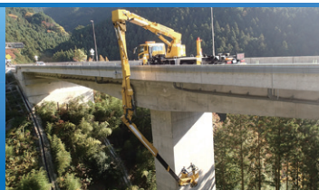
国道33号 つづら川第1橋点検(愛媛県)