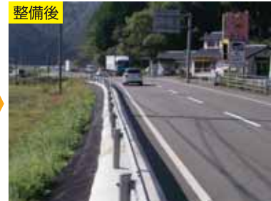
除草におけるコスト縮減