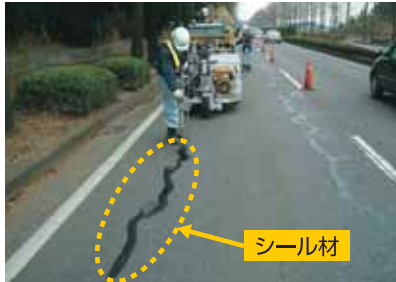
舗装修繕におけるコスト縮減