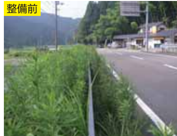
除草マットの設置