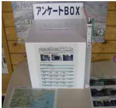
道の駅「日和佐」のアンケートBOX

■歩き遍路の方々への安全対策として、外側線外側にグリーンの路面標示を行い、あわせて、ドライバーにも歩き遍路さんへの思いやり運転を呼びかけるための案内看板を設置しています。また、いくつかの休憩所や「道の駅」にアンケートBOXを設置しておりますのでご意見を是非お聞かせください。