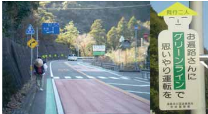
グリーンラインの展開