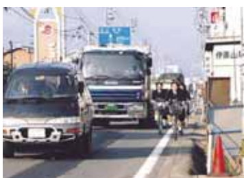
現在の状況 新居浜市本郷