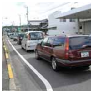
現在の状況 六ノ坪交差点