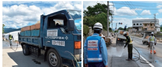
人力等による清掃状況