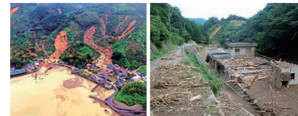
宇和島市吉田町の土砂災害