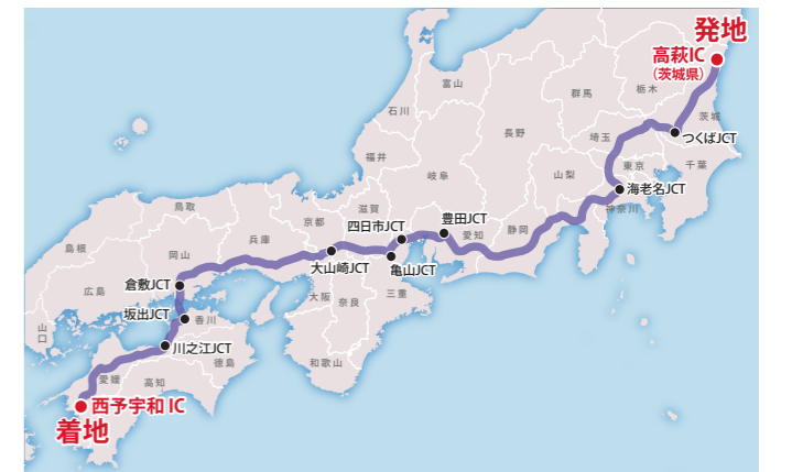
■「浄水プラント」の輸送ルート