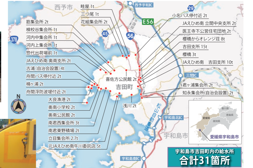
■散水車で生活用水を運搬した宇和島市吉田町内の給水所