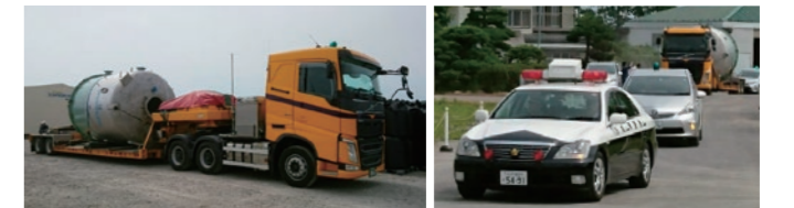
「浄水プラント」を積載した特殊車両