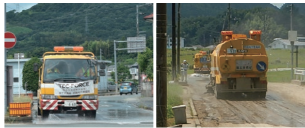
路面清掃車等による清掃状況