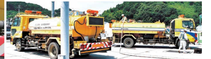
生活用水運搬に活躍する散水車