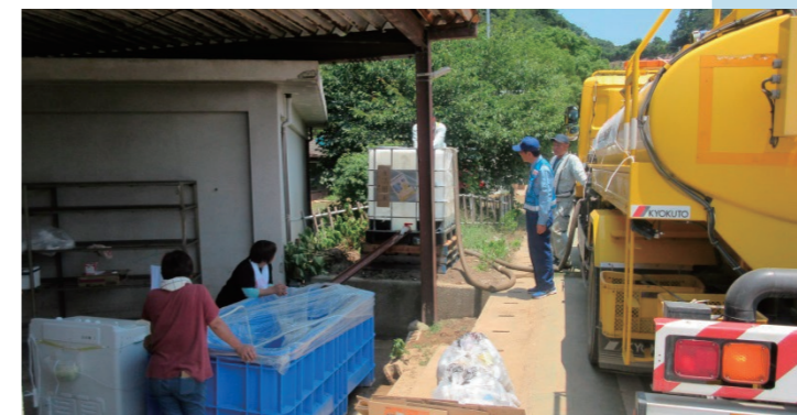
配布場所での給水作業