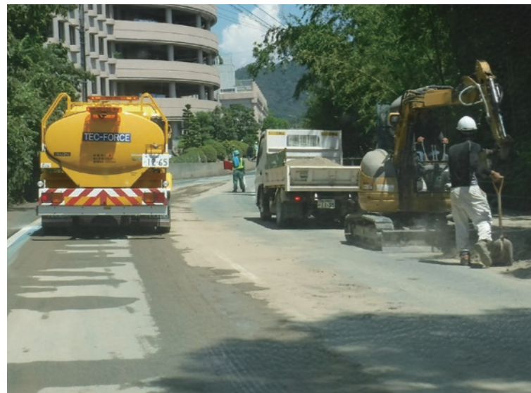
国(左)・県(右)の合同清掃作業