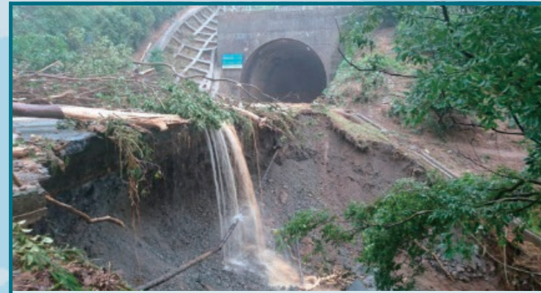
国道56号 愛媛県宇和島市(7月7日早朝)