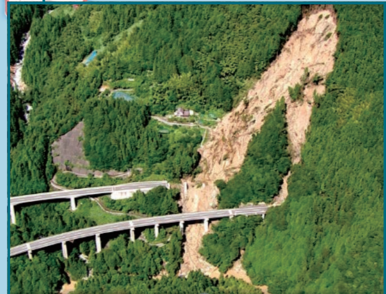
E32高知自動車道 高知県大豊町(7月7日未明)