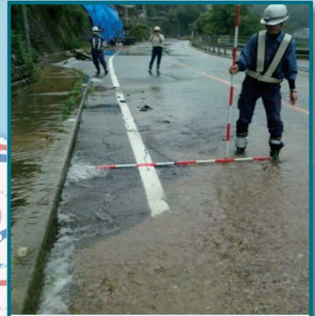
国道32号 徳島県三好市(7月6日夜)