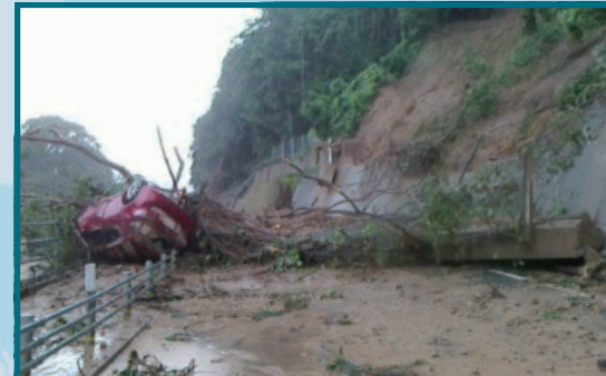
国道56号 愛媛県宇和島市(7月7日早朝)