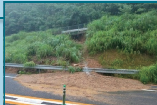
E56松山自動車道 愛媛県宇和島市(7月7日早朝)