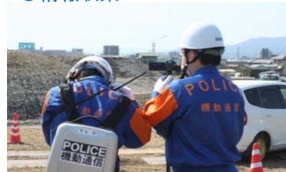
警察による情報収集