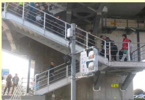
緊急避難階段を活用した避難訓練の様子