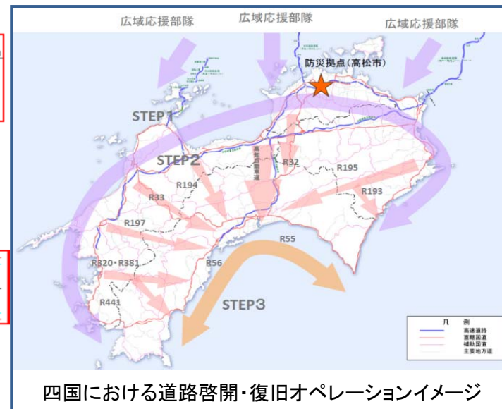
四国における道路啓開・復旧オペレーションイメージ