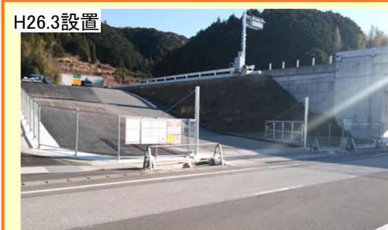
南国安芸道路に設けられた緊急連絡路