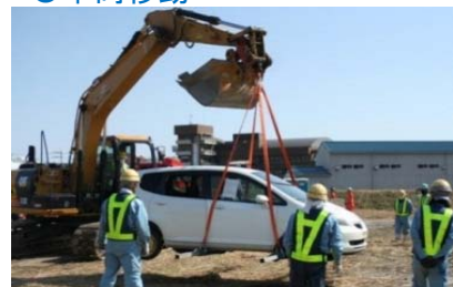
バックホウによる車両