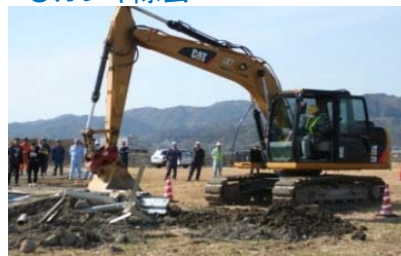
バックホウによる除去