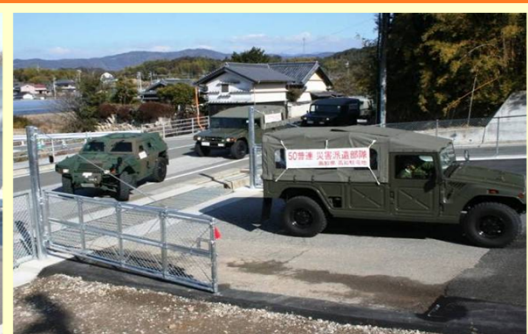
緊急連絡路を使った侵入訓練の様子