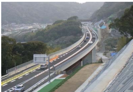
平成27年3月22日に開通した高知南国道路