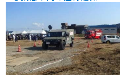
自衛隊車両の通行確保