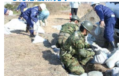
土嚢による段差解消