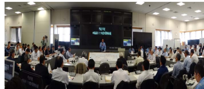
四国南海トラフ地震対策戦略会議の状況