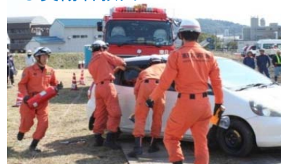
レスキュー隊による負傷者救出