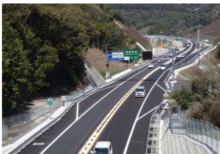
平成27年3月21日に開通した宇和島道路