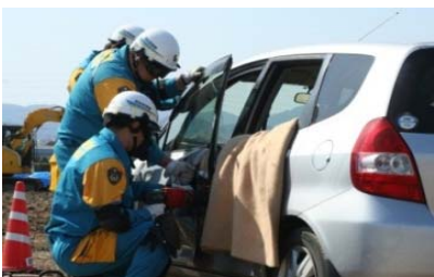
警察による負傷者救出