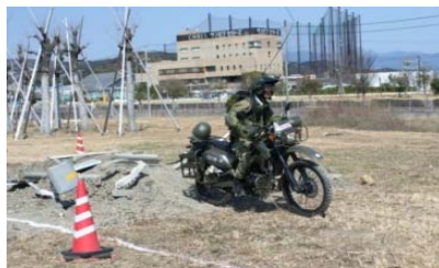
自衛隊による情報収集