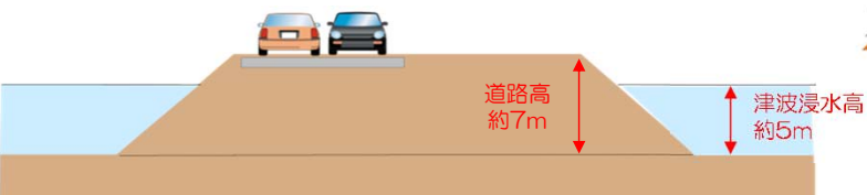
高知南IC付近の津波浸水予測