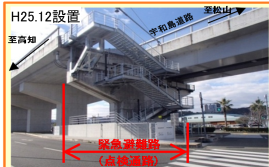
宇和島道路に設けられた緊急避難階段

・津波等の災害発生時に道路利用者や沿道住民の方々が高台への『緊急避難路』として利用可能な避難階段を整備する。平成27年度は、高知東部自動車道(なんこく南IC-高知龍馬空港IC間)に設置する。